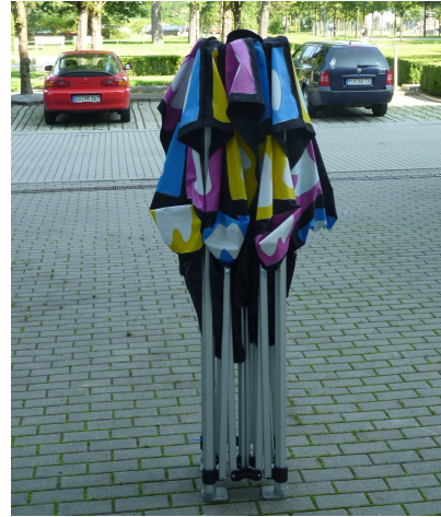
Gestell mit Dach

Tunnel ist für Innenveranstaltungen geeignet, im Freien nur, wenn die Überdachung des Tunnels gewährleistet ist! Der Tunnel hat eine Größe von 3x3 m, dabei ist die Lichte Höhe von 3,50 m beachten!