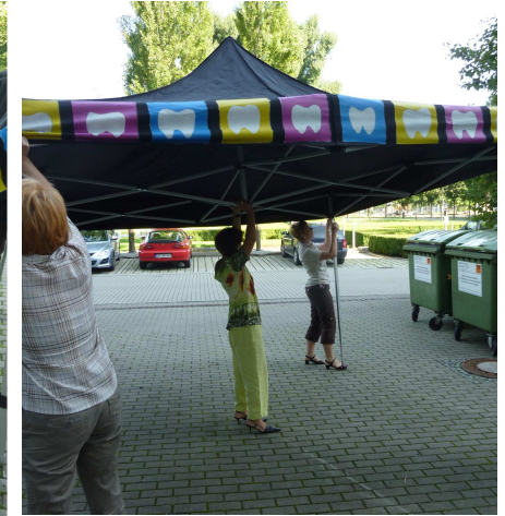
Gelenk in der Mitte hoch drücken. Höhe einstellen: mit dem Fuß das Gestell am Boden halten, Stange hochziehen, bis es einrastet.