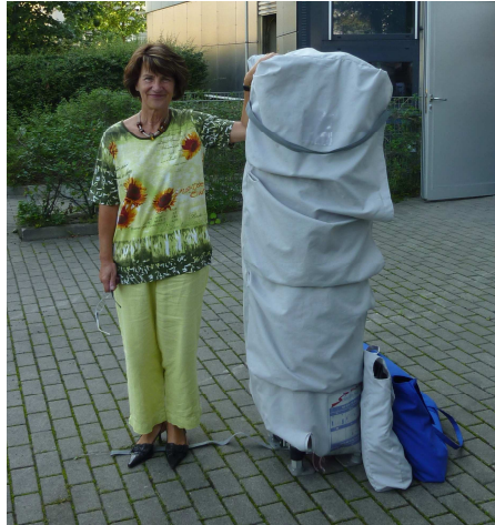
Tunnel verpackt (Gestell und zwei Taschen)